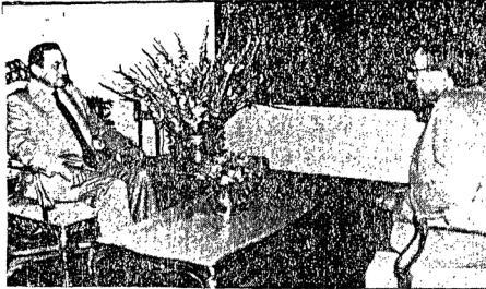
الرئيس حسنى مبارك خلال حديثه لمندوب هيئة الإذاعة وتلفزيون ألمانيا

ج : لو قمنا بإنشاء حزب مسيحي وإسلامي فسيفتقالتون فالإسلاميون قد يكونون ١٥ حزبا كذلك المسيحيون ونحن لا نسمح بوجود الأحزاب الدينية في عالمنا .